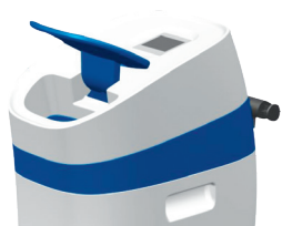
Couvercle blocable en position ouverte