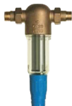
Filtre laiton THP autonettoyant avec poignée de vidange