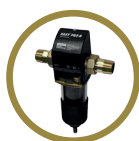
Filtere autonettoyant semi-automatique à tamis inox Réf: FMEXEL